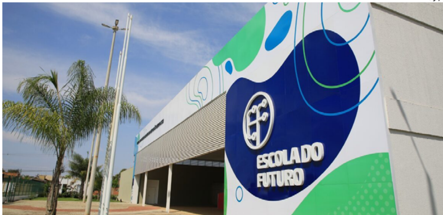
As vagas estão distribuídas entre 90 vagas para cursos de qualificação e 90 de capacitação, em cada município

“Cada uma das Escolas do Futuro de Goiás tem R$ 7 milhões investidos apenas em laboratórios. São escolas de primeiro mundo voltadas para o ensino técnico, a fim de dar oportunidades rápidas de trabalho aos goianos, e em áreas do mercado que pagam bem. Por isso, sob determinação do governador Ronaldo Caiado, investimos pesado na área”, diz