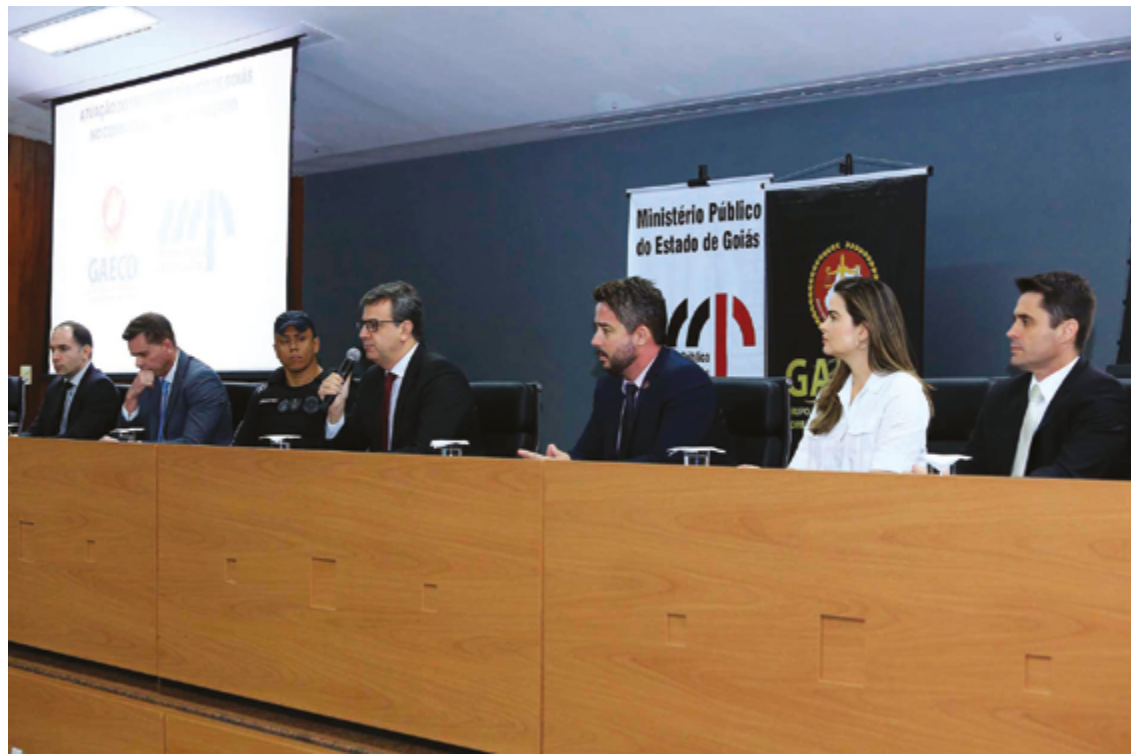
Corregedor-geral de Justiça, Cyro Terra: "é prioridade máxima do MPGO o combate ao crime organizado e às facções"

Em seguida, a Operação Família, deflagrada no dia 15 de setembro de 2023, cumpriu um mandado de busca e apreensão e dois de prisão preventiva, sendo um deles contra uma advogada. Até o momento, três pessoas foram denunciadas, sendo dois advogados. Além disso, houve a transferência de um réu para o sistema penitenciário federal (Penitenciária Federal de Mossoró).