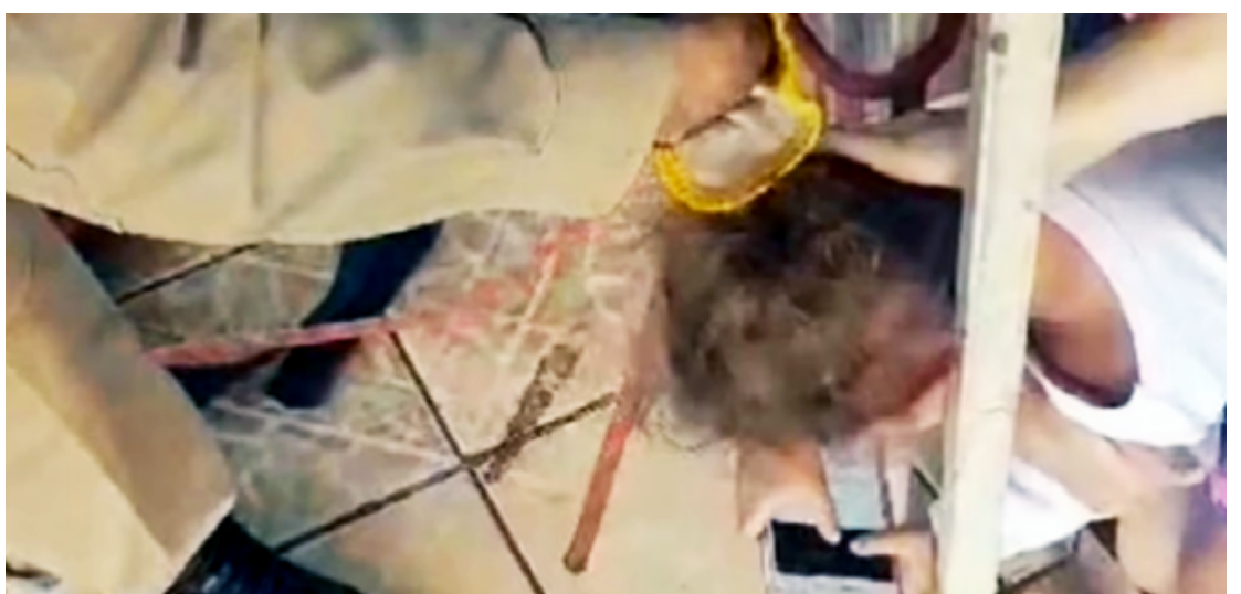
Os socorristas chegaram prontamente à residência e, utilizando técnicas apropriadas, conseguiram expandir a grade de ferro para liberar a cabeça da criança

Este episódio ressalta a importância da vigilância constante e da adoção de medidas preventivas para garantir a segurança das crianças em ambientes domésticos. A rápida resposta dos bombeiros foi fundamental para resolver a situação e assegurar o bem-estar da criança, proporcionando alívio à família envolvida.