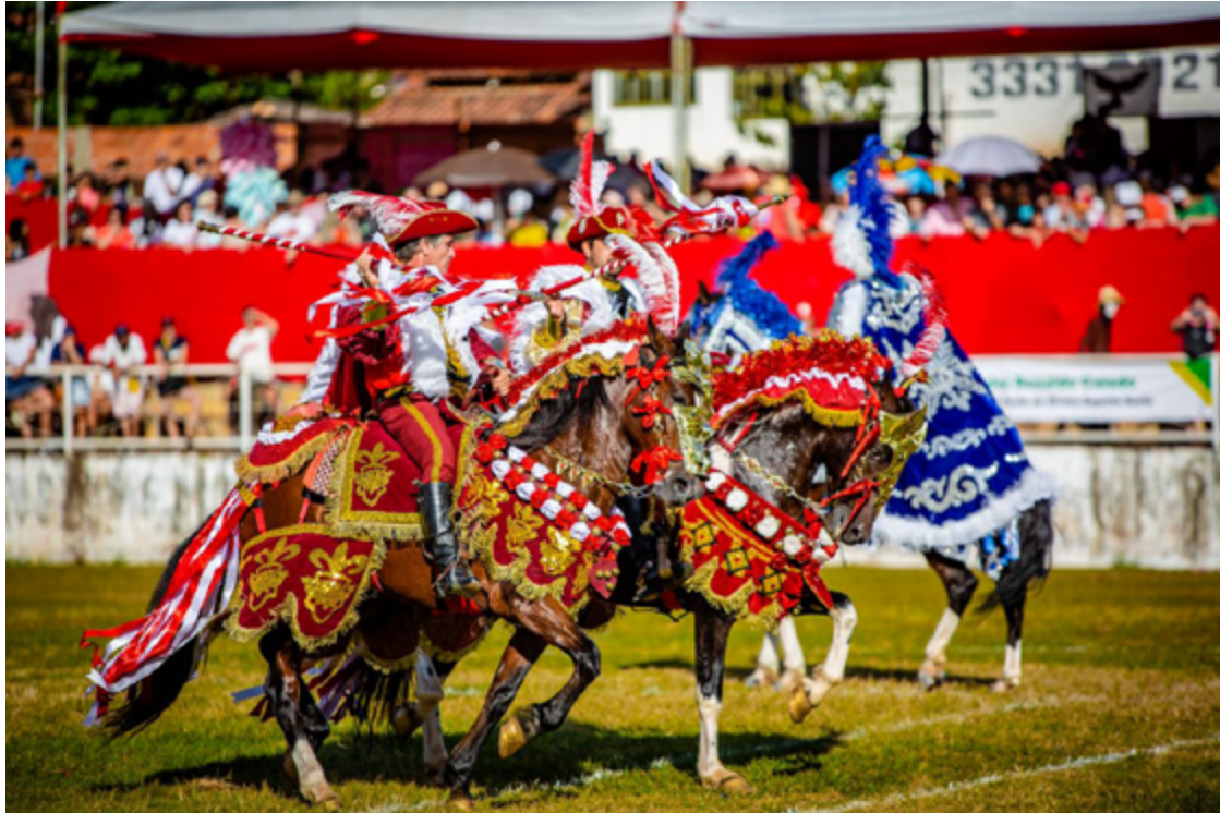
A celebração do Divino Espírito Santo é marcada por uma série de eventos e rituais de fé e devoção da comunidade pirenopolina e visitantes

Um dos momentos mais aguardados são as Cavalhadas, que neste ano serão realizadas nos dias 19, 20 e 21 de maio, no Módulo Esportivo da cidade. As Cavalhadas recriam as épicas batalhas medievais entre Mouros e