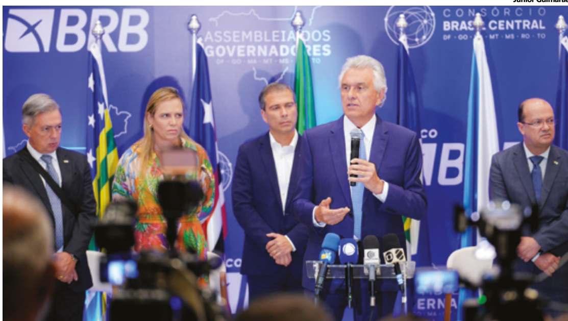
Ronaldo Caiado, durante encontro com gestores de cinco estados e do Distrito Federal, refuta “prato feito”

“Nós somos os geradores de impostos, não cabe a nós receber um prato feito da União”, defendeu Caiado em sua fala