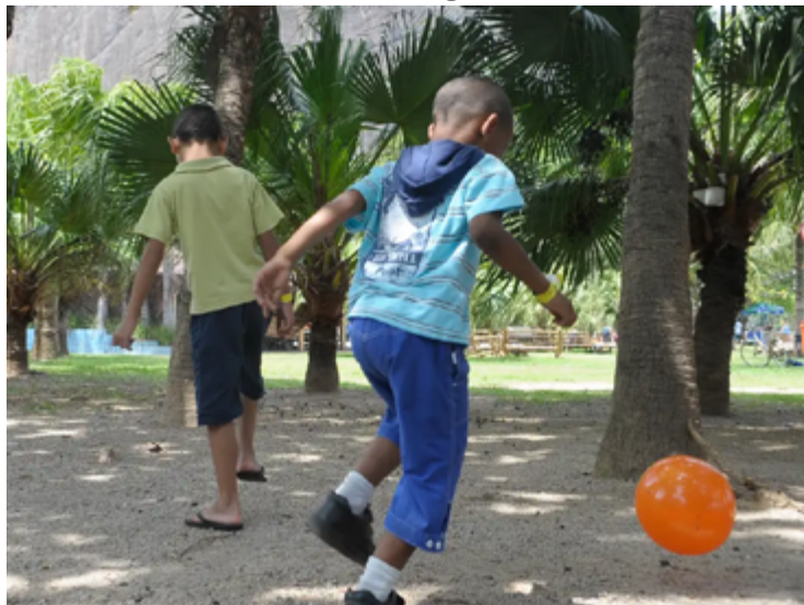
Assunto vai ser debatido no 4º Congresso Brasileiro de Urgências e Emergências Pediátricas

Para a SBP, as estatísticas demonstram a importância de manter cuidados preventivos para evitar acidentes e proteger a integridade física das crianças. A entidade avalia os dados como impactantes e destaca que grande parte desses eventos poderia ter sido evitada com medidas simples de pre-