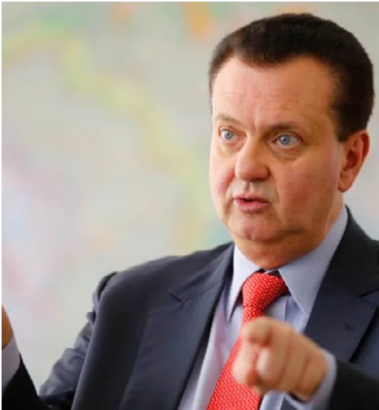
Gilberto Kassab: PSD revigorado no mapa dos prefeitos brasileiros

Mesmo perdendo o posto de partido com mais prefeitos, o MDB também cresceu: ocupa o segundo lugar, saindo de 793 prefeitos eleitos em 2020 para os atuais 916. Estados governados pelo partido como o Pará e Alagoas