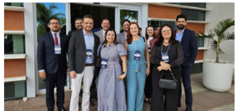
Delegação da Sead/Goiás participam de congresso