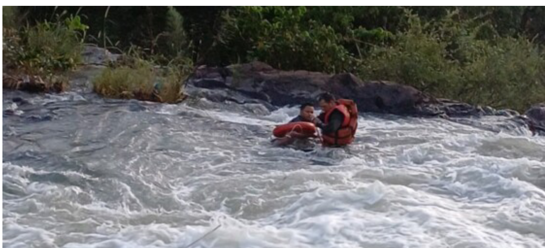
A vítima estava acompanhada de sua irmã e de duas crianças durante o incidente

Apesar do susto, a vítima apresentava apenas escoriações nos membros superiores e inferiores, sem ferimentos graves