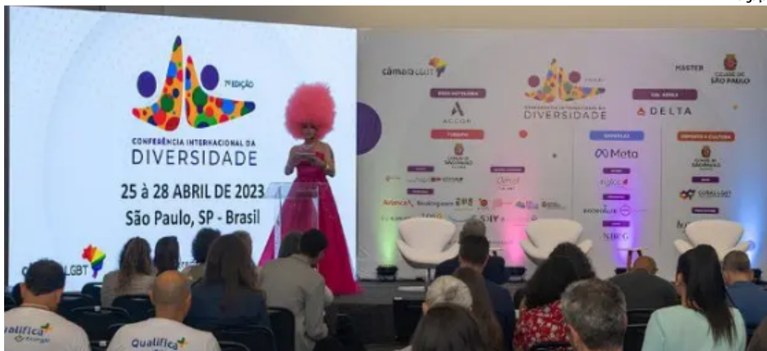
O estado vai ter um espaço para debater sobre a diversidade no Turismo e para mostrar os produtos e ações em curso em Goiás em prol do público LGBTI+, durante a conferência.

A diversidade no estado para receber visitantes começa na moderna capital Goiânia, passa pelo cenário de volta ao passado da cidade de Goiás, a espiritualidade única da Chapada dos Veadeiros, o charme de Pirenópolis e as águas quentes de Caldas No-