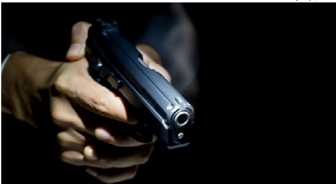
O autor dos disparos fugiu do local e ainda não foi localizado pelas autoridades.

Enquanto isso, a população aguarda ansiosamente por respostas e ações efetivas das autoridades para prevenir a ocorrência de novos atos de violência e garantir a segurança de todos os cidadãos.